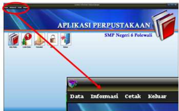
Gambar 3. Desain Form Utama

Setelah User memasukkan ID nama Usernya maka akan tampil halaman atau jendela utama Aplikasi Perpustakaan :