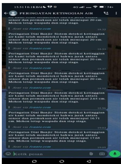
Gambar 2 tampilan pesan peringatan di aplikasi whatsapp

Pengiriman notifikasi melalui WhatsApp terbukti efektif dalam memberikan peringatan dini. Setiap kali ketinggian air mencapai status Bahaya, pesan peringatan dikirimkan secara otomatis, memungkinkan pengguna untuk segera mengambil tindakan pencegahan. Contoh sebagai berikut: